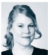
Katrin Nemecek H,T,P, Concept, Berlin | www.htp-concept.com